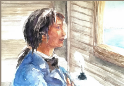
湊里香 川尻浦 久蔵 個人蔵

「CREATA」第13号・第18号 昭和44年(1969)3月、昭和45年6月 日本メルク萬有株式会社 絵 村上豊 笠原良策・中川五郎治について描いた短篇小説。